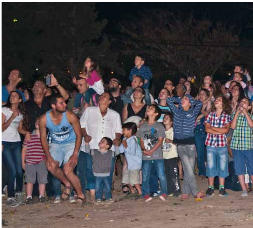
Collective picture, 2014 Lambda print, 178 x 80