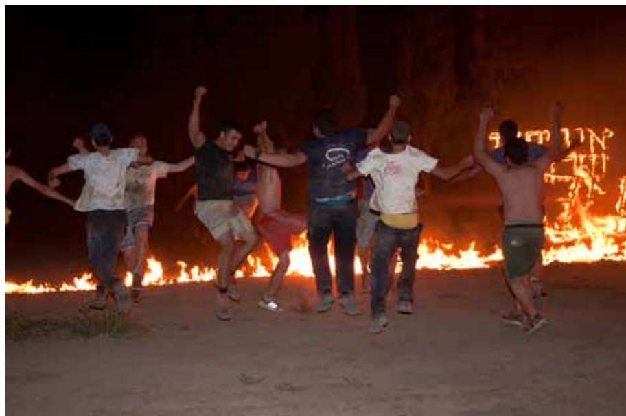
The young dance, 2014 Transparency lambda, light box, 70 x 50