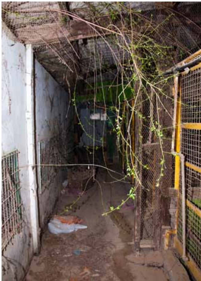
Negligence, 2014 Lambda print, 55 x 40