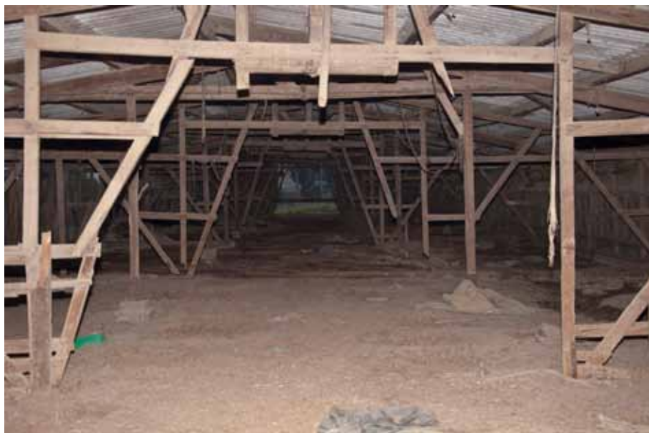
Hen-house, 2014 Lambda print, 110 x 80