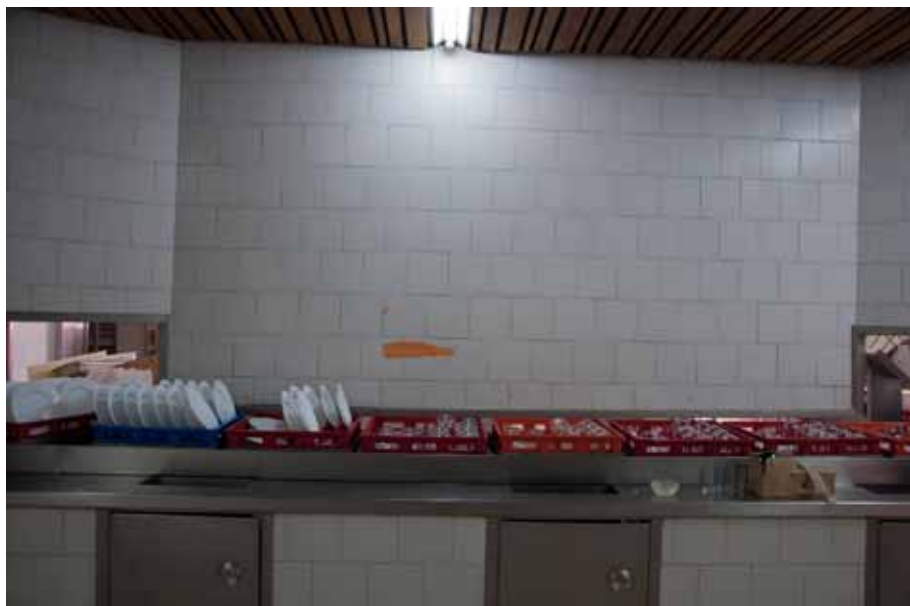
Torn announcement, 2014 Lambda print, 60 x 40