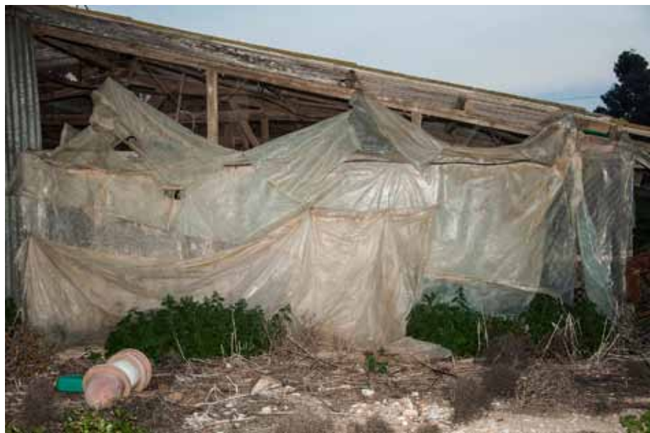
Wrapped with pity, 2014 Lambda print, 90 x 60