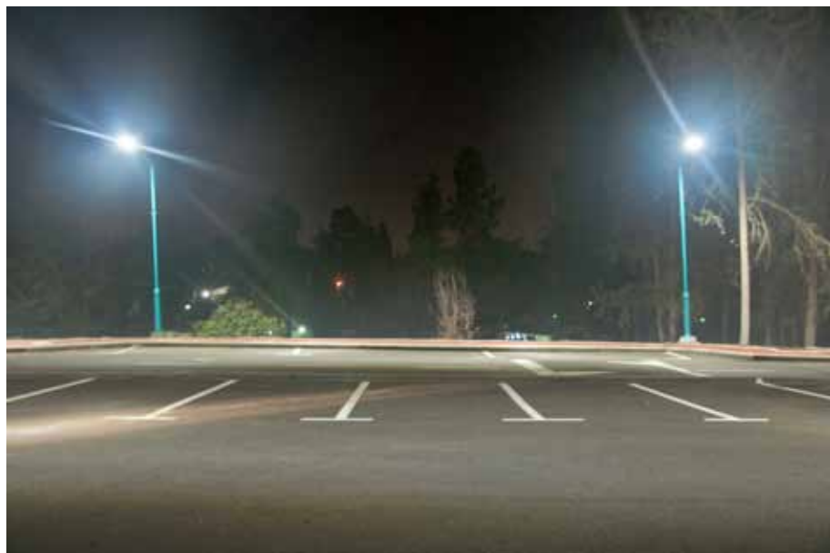
New view, 2014 Lambda print, 120 x 80