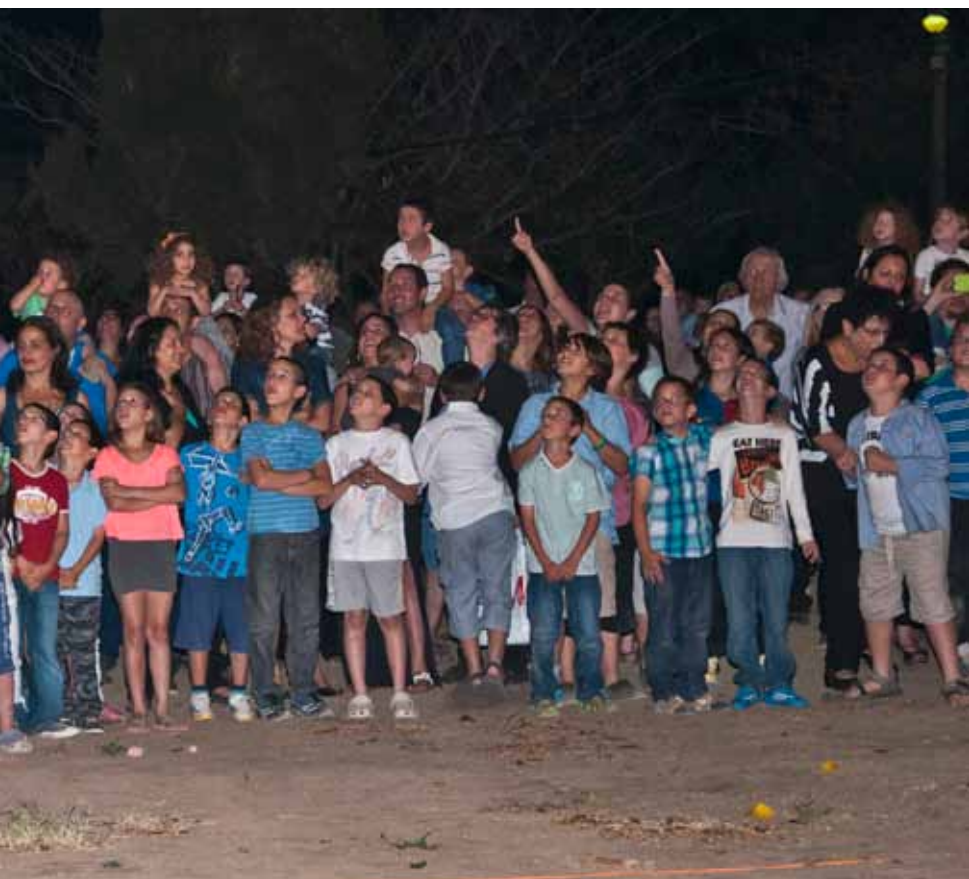
תמונה קבוצתית, 2014 הדפס למדה, 178 x 80