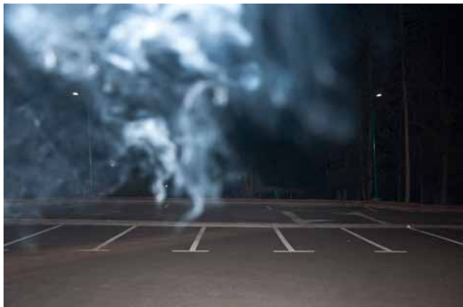
Smoke, 2014 Lambda print, 90 x 60