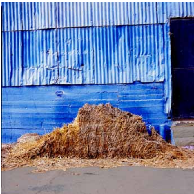
Crumbling, 2008 / 2014 Lambda print, 100 x 90