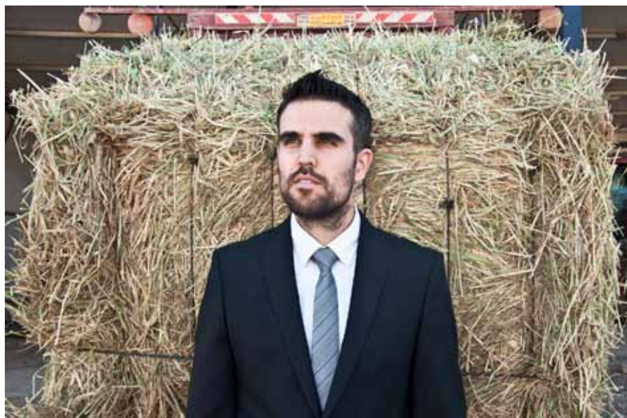
The next generation 2, 2014 Lambda print, 83 x 60