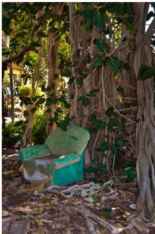
Armchair, 2014 Lambda print, 120 x 80