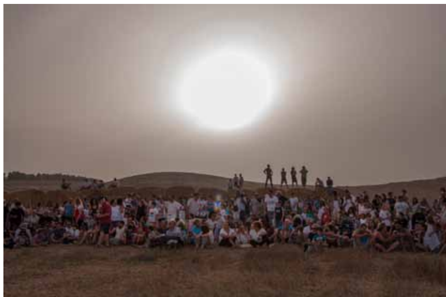
The sun of the nations, 2014 Transparency lambda, light box, 70 x 50