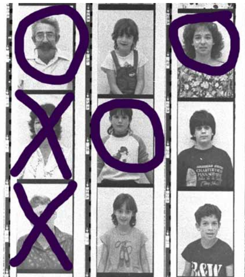
X-Mix, 1999 / 2014 Inkjet print, 60 x 40