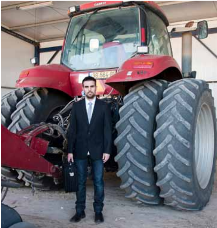
The next generation 1, 2014 Lambda print, 75 x 60