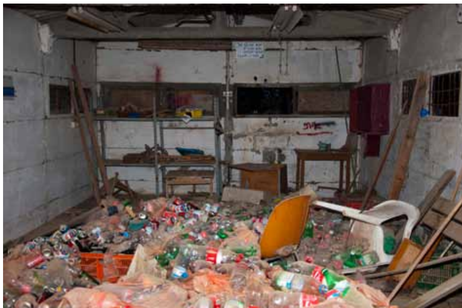
Workshop of members, 2014 Lambda print, 90 x 60